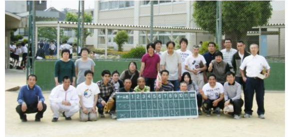
精道中と交流ソフトボール大会