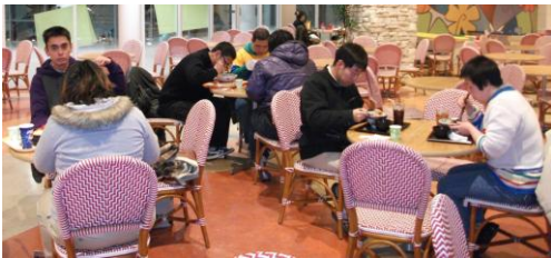
↑ホームレク ららぽーとで外食

カラオケ、ボーリング、買い物、外食、ナイトハイキング、プロ野球観戦、卓球、バーベキュー・・・等