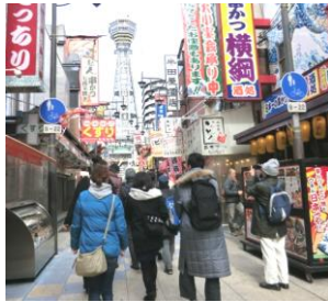
通天閣へ行きました。