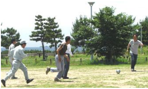
写真：芦屋市総合公園でサッカー

年間合同行事 4月 お花見ハイキング 7月、8月 水泳訓練 8月 納涼会 野球観戦(甲子園球場) 春と秋 精道中学校との交流ソフトボール大会 10月 親子ハイキング 12月 忘年会 1月 新年会 2月 一泊遠足 毎月第3土曜日 クラブ活動(カラオケ、水泳、卓球、その他) 毎月 昼食会(誕生日会) その他の企画もしています。