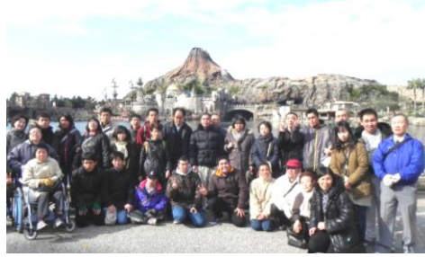
東京ディズニーシー♪