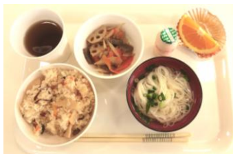
栄養士さんが作ってくれる美味しい食事