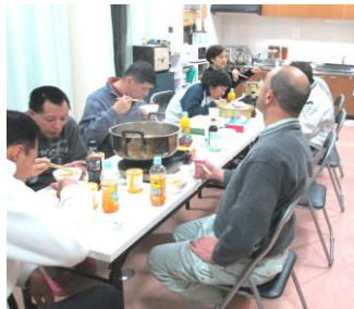
←ホームレク 鍋パーティ